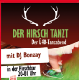
15.02. – 20:00 UHR DER Ü40-TANZABEND IN DER HIRSCHBAR