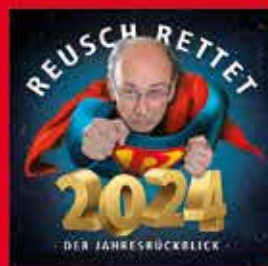
14.01. – 19:30 UHR DIE GROSSE BÜHNENSHOW COMEDY