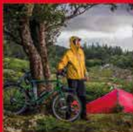
05.01. – 17:00 UHR MULTIVISIONSSHOW IRLAND MIT ROBERT NEU