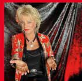
13.02. – 19:30 UHR KABARETT MIT LISA FITZ MIT VOLLGAS AN DIE WAND