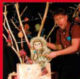
09.02. – 11:00 UHR PUSCHEL UND DER WINTERSCHLAF AB 2 JAHREN