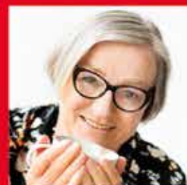
22.01. – 19:00 UHR LESUNG ÜBER EINE UNMÖGLICH LIEBE ZUM 2. WELTKRIEG