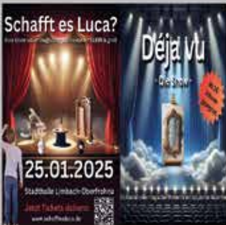
25.01.2025 15 + 19 Uhr Eine Show voller magischer Momente.