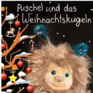
01.12.2024 11 Uhr Musikalisches Theater für Familien mit Kindern ab 2 Jahren.