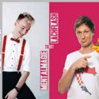
03.05.2025 20 Uhr Die Show, die euch verzaubert und gleichzeitig zum Lachen bringt.