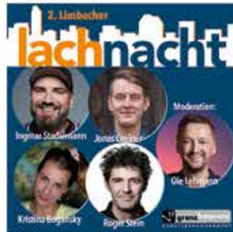
01.12.2024 19 Uhr Es wartet erneut ein fantastischer Mix aus Kabarett und Comedy auf Sie!