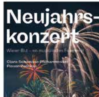
04.01.2025 16 Uhr Wiener Blut: ein musikalisches Feuerwerk.