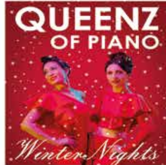
08.12.2024 17 Uhr Hits der Rock und Popmusik auf dem Piano interpretiert.