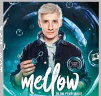
12.04.2026 17 Uhr Zaubershow zum Lachen und Staunen für die ganze Familie!