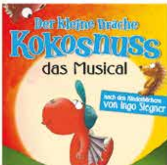
13.12.2024 16 Uhr Das Musical ist für Kinder ab 4 Jahren geeignet.