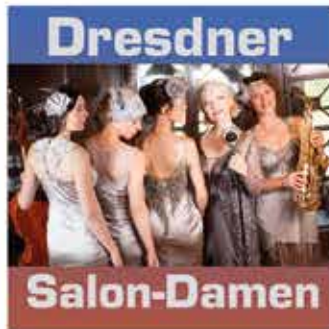
23.11.2024 19 Uhr Violoncello, Violine, Klarinette und Klavier zu „Der Wind hat mir ein Lied erzählt“.