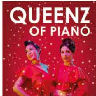
08.12.2024 17 Uhr Rock- und Pophits treffen auf Klaviertöne.