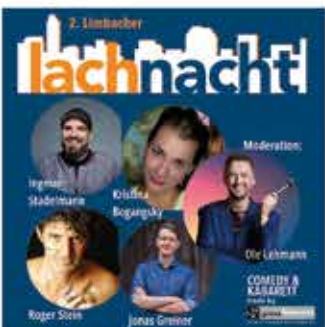
01.12.2024 19 Uhr Ein Abend mit einem Mix aus Kabarett und Comedy.