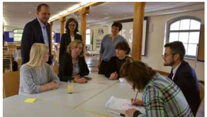
Gemeinsam kreative Ideen entwickeln war das Ziel des Workshops am 14. Oktober im Esche-Museum.

Verknüpfung mit der Organisationsstruktur der Plattform Kreatives Sachsen“, betonte sie weiter. Oberbürgermeister Gerd Härtig, der beim Workshop kurz vorbeischaute, erklärte, dass die Stadt durch den Neubau des Hippodroms die Veranstaltungsräume in der dritten Etage freigeben werde und auf Fördermittel für den Ausbau des 4. Obergeschosses der historischen Fabrik hoffe.