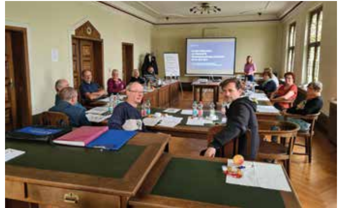
Das Bild zeigt die Schulungsveranstaltung der Interviewer am 26. April im historischen Gemeindesaal des Rathauses Pleiße.

Erhebungsstelle zum Zensus im Rathaus Pleiße unter 03722/4693800 oder unter zensus.limbach-oberfrohna@statistik.sachsen.de gern zur Verfügung.